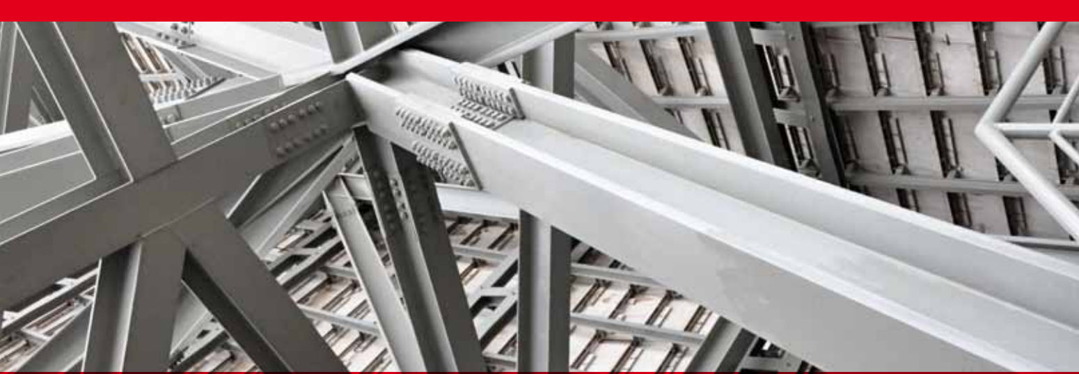
Projektierung kompletter Anlagen und Systeme / Service