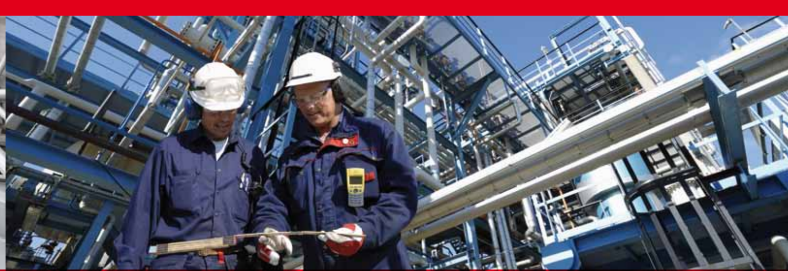
Conception d'installations complètes et systèmes / services

Optimal ist es, den Zustand der Hydraulikmedien und technischen Teile kontinuierlich im Blick zu haben. Die Zustandsüberwachung, das Condition Monitoring, ist hierfür die Lösung. Wir verfügen über ein umfangreiches und erprobtes Sortiment an solchen Produkten, sowohl für die Fluidpflege und -überwachung als auch für die technische Sauberkeit von Bauteilen.