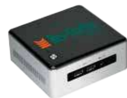
RexStation Station de travail

> Station de travail Intel i3, i5 et i7, SSD. La station se fixe au dos de l'écran pour une plus grande discrétion.