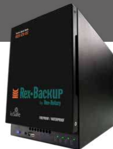
RexBackup Solution de sauvegarde blindée Assemblée par Rex Rotary

> Sauvegarde de données Gamme RexBackup blindée, ignifuge, hydrofuge Une box qui offre un nombre important de fonctionnalités, comme un FTP, un VPN, un service de réplication entre deux sites distants ou encore un serveur SVN (Subversion)