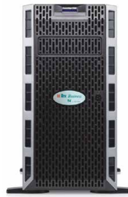
Rex Business Serveur de documents

Nous détectons les défaillances à distance pour anticiper les problèmes, être pro-actifs et réagir avant que le problème ne surgisse.