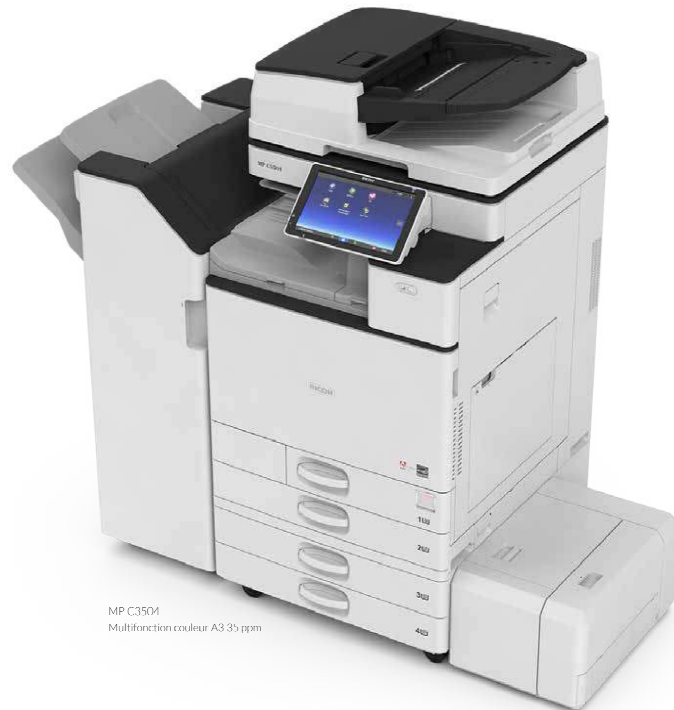
MP C3504 Multifonction couleur A3 35 ppm