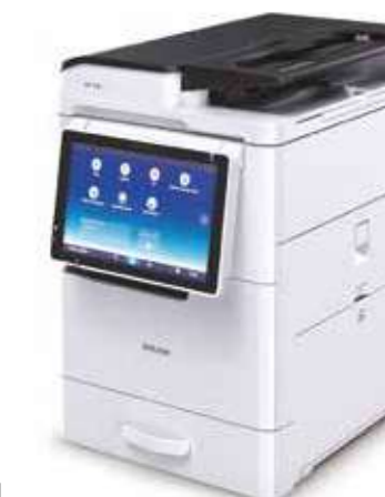
MP 305+SP Multifonction N&B A4 30ppm

Appareils photos - Accessoires de finitions - Destructeurs de documents - Cisailles - Agrafeuses électriques - Papiers